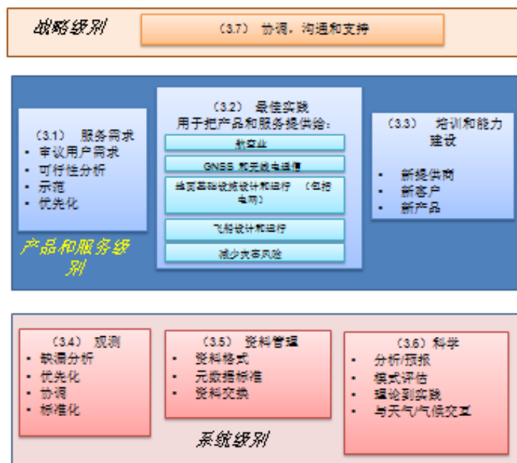
图 1: 拟议的主要活动功能细分示意图