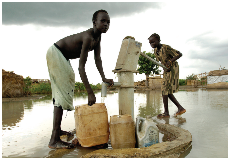
Дети, вынужденные покинуть свои дома, добывают воду после наводнений в Судане в 2008 г.

Климатическое обслуживание сосредоточено на более долгосрочных оценках климата в разное время года, например температура и осадки для разных мест и месяцев или средняя частота повторяемости экстремальных явлений, таких как волны тепла или наводнения. Эта продукция очень важна для планирования. За последнее время наши знания о климатической системе и изменении климата расширились, поэтому традиционную статистическую продукцию дополняют прогнозы