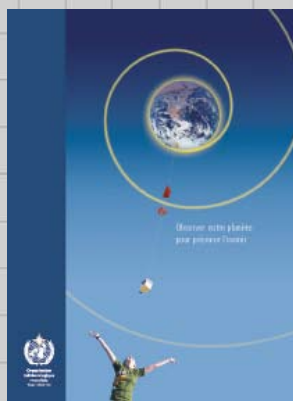
Observer notre planète pour préparer l'avenir (dossier contenant la brochure (OMM-N° 1030), une affiche et le message du Secrétaire général) [E]-[F]-[R]-[S]

peuvent être re-traitées et les variations dans ces domaines analysées afin d'obtenir une description cohérente du système climatique.