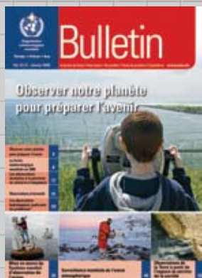
Bulletin de l'OMM 57 (1) janvier 2008 (thème "Observer notre planète pour préparer l'avenir") (sous presse)