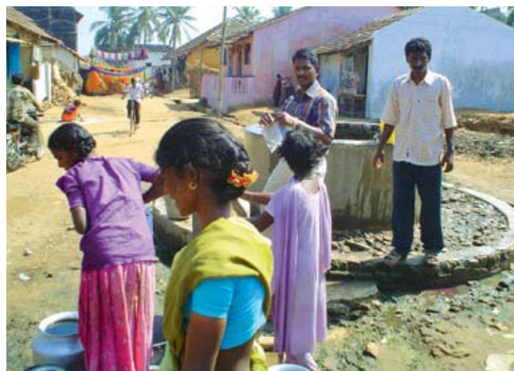
L'OMM œuvre pour préserver la santé en garantissant une eau salubre et un environnement moins vulnérable aux catastrophes naturelles.

L'OMM souligne l'importance de la réduction des risques de catastrophes dans le cadre de stratégies d'adaptation au changement climatique.