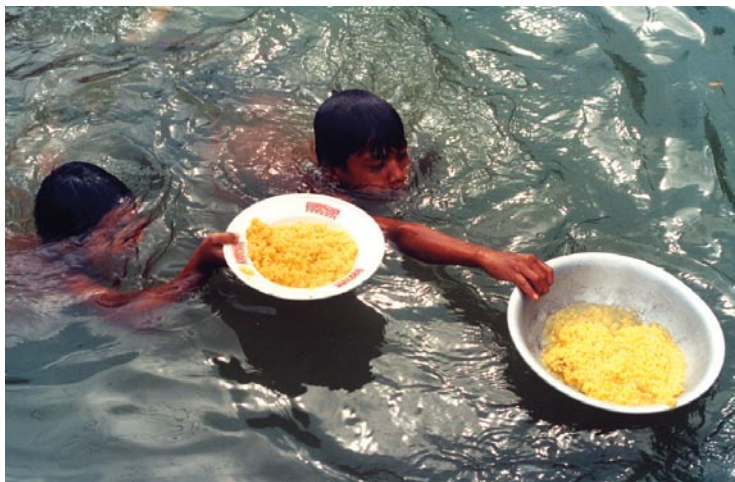
Les crues sont la catastrophe naturelle d'origine hydrométéorologique la plus fréquente. Les populations des pays en développement sont les plus vulnérables.

La gestion intégrée des crues constitue un investissement très rentable. Par exemple, lorsqu'une crue de grande ampleur s'est produite le long de l'Aa d'Engelberg, rivière de montagne tribulaire du lac des Quatre-Cantons, en Suisse, ce mode de gestion a contribué à faire la part entre les dommages que peuvent provoquer les crues et les avantages liés à l'utilisation de la plaine inondable. La trentaine de millions de francs suisses investis