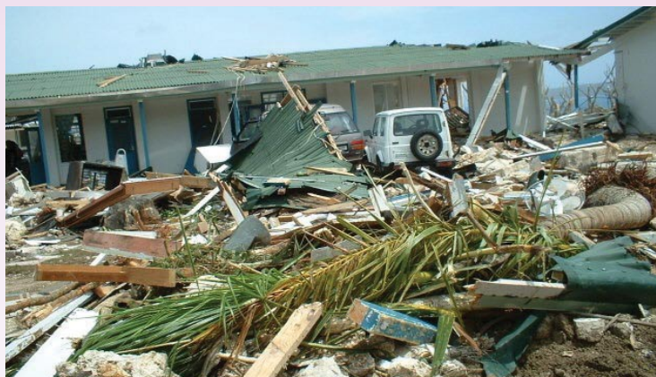
Le cyclone tropical Heta a semé la désolation sur l'île de Niue, dans le Pacifique Sud en 2004. Le Projet de démonstration concernant la prévision des conditions météorologiques extrêmes sera consacré aux fortes pluies, aux vents violents et aux vagues destructrices dans les îles du Pacifique Sud.

D'autres recommandations visent à améliorer l'information sur le temps et le climat à l'attention des agriculteurs, par exemple en