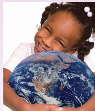
Troisième Conférence mondiale sur le climat (31 août-4 septembre 2009): en détail sous www.wmo.int/wcc3

Le développement de services climatologiques bénéficie d'un socle consistant d'observations, de contrôles