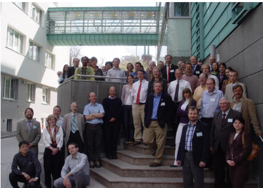
Participants à l'atelier CLIMAR-III

Comme les précédents ateliers, CLIMAR-III a rassemblé les scientifiques qui s'efforcent de produire des jeux de données de qualité sur la météorologie de surface, sur les interactions atmosphère-océan et, de plus en plus, sur la couche sous-jacente de l'océan. Il a attiré 69 participants de 19 pays (représentant toutes les Régions de l'OMM sauf une) qui s'intéressent aux applications de la climatologie maritime, à l'archivage et la récupération des données et aux recherches sur le climat, y compris la modélisation.