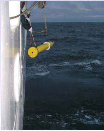
Déploiement des bouées Argo canadiennes dans la mer de Béring le 24 octobre 2007

température et de salinité de l'eau des océans à une profondeur de 2 000 mètres et d'estimer les courants à cette profondeur avec un maillage horizontal de 3 degrés par 3 degrés.