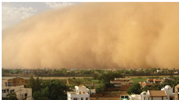
L'OMM veille à ce que toutes les régions du monde touchées par les tempêtes de sable et de poussière aient accès à des prévisions et à des analyses.

Le 1 er novembre 2007, le réseau mondial de flotteurs profilants servant à mesurer la température et la salinité connu sous le nom d'Argo a atteint son objectif initial de 3 000 flotteurs profilants opérationnels. Le programme a débuté en 1998 et prévoyait de réaliser des profils de