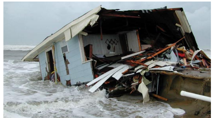
Domages provoqués par une onde de tempête

Lors d'une tempête typique, la poussée touche environ 150 à 200 km de côtes sur une période de plusieurs heures. Les tempêtes de plus grande envergure se déplaçant lentement peuvent toucher des bandes de littoral considérablement plus longues.