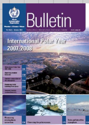
Bulletin de l'OMM 56 (4), octobre 2007 (thème «Année polaire internationale 2007-2008») (sous presse)